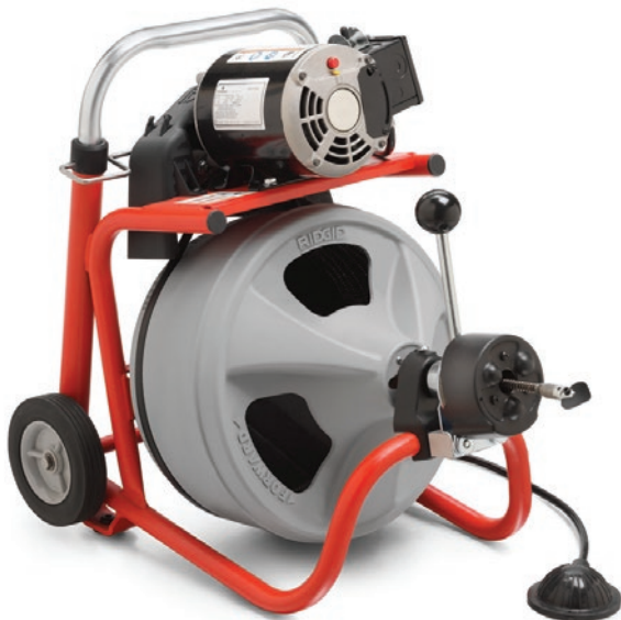
Модель K-400 с устройством автоподачи AUTOFEED®