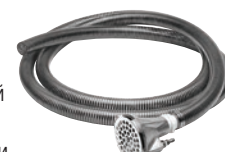
Ⓜ лок – илосос

Илосос прикрепляется к любой передвижной гидродинамической машине для быстрого удаления (вакуумирования) жидкости и грязи из затопленных подвальных помещений, сточных колодцев, плавательных бассейнов, стройплощадок, колодцев автомоек и т.д. Это снижающее затраты и экономящее время изделие будет перемещать до 60 галлонов жидкости в минуту.