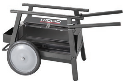
200A со стальным ящиком