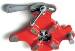
Резьб. головка 555

R = Станки моделей 1233, 535-535A и 300, 300 Compact и 300-A с кареткой.