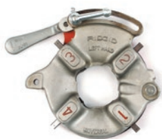
856/842 Универсальная резьбонарезная головка