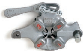
№ 532 Резьб. головка для болтов