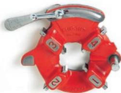
811A Быстрооткрывающаяся головка