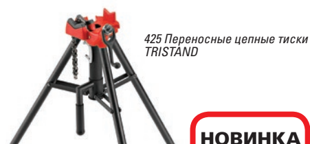
425 Переносные цепные тиски TRISTAND