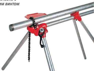
Цепные тиски на подставке с верхним винтом

** Для модели 460-6 имеются губки для пластмассовых труб, по каталогу 41280; губки заказываются отдельно.