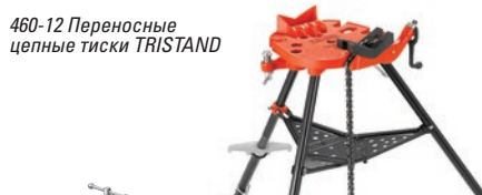
460-12 Переносные цепные тиски TRISTAND