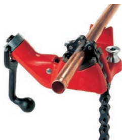
Цепные верстачные тиски с верхним винтом