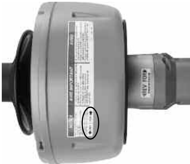
Рис. 5 – Этикетки ВПЕРЕД/НАЗАД (FOR/REV)

8. Не нажимайте рычаги подачи инструмента (только на инструментах с автоподачей AUTOFEED). Нажмите тумблер включения питания (ON/OFF) и определите направление вращения барабана по сравнению со стрелками ВПЕРЕД/НАЗАД (FOR/REV) на наклейках. Если тумблер выключения питания (ON/OFF) не управляет работой инструмента, не используйте инструмент для чистки канализации до тех пор, пока тумблер не будет отремонтирован. Отпустите тумблер и дождитесь полной остановки барабана. Переместите переключатель ВПЕРЕД/НАЗАД (FOR/REV) в другое положение, и повторите описанную выше процедуру проверки правильности вращения инструмента для чистки канализации в обратном направлении.