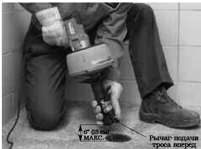
Рис. 10 – Автоматическая подача троса в режиме AUTOFEED

Проверьте, что трос на длину не менее 30 см (12") введен в канализационную трубу, а выход троса из инструмента для чистки канализации располагается на расстоянии не более 30 см (6") от входного отверстия канализационной трубы. Переместите рукоятку в сторону от барабана, чтобы освободить трос в зажимном патроне. Запрещается включать зажимной патрон в режиме автоподачи AUTOFEED. Для пуска инструмента включите тумблер электропитания ON/OFF. Чтобы переместить трос вперед в канализационную трубу, нажмите рычаг подачи вперед. Вращающийся трос начнет поступать в канализационную трубу. Не следует допускать накручивания, изгиба или искривления троса перед входным отверстием канализационной трубы. Это может привести к перекручиванию, перегибу или обрыву троса.