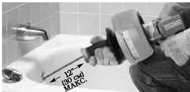
Рис. 8 – Переместите рукоятку в сторону к барабану, чтобы зажать трос зажимным патроном

Если подача кабеля вперед затрудняется, для улучшения захвата и подачи троса можно использовать зажимной патрон. Переместите рукоятку в сторону к барабану, чтобы зажать трос в зажимном патроне. Во время вращения троса (тумблер ON/OFF включен в положение ON) переместите инструмент для чистки канализации к входному отверстию канализационной трубы, чтобы протолкнуть трос внутрь. Отпустите тумблер включения-выключения питания (ON/OFF). Переместите рукоятку в сторону от барабана, чтобы освободить трос в зажимном патроне. Рукой, на которой надета рукавица, захватите трос во избежание его выскакивания наружу из канализационной трубы и переместите инструмент для чистки канализации назад так, чтобы на воздухе находилось не более 12" (30 см) троса. Повторяйте вышеуказанные операции, продолжая таким образом перемещать трос вперед. (См. рис. 8-9.)