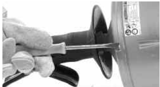
Рис. 13 – Слегка отверните 4 винта барабана примерно на 3 полных оборота, но не извлекайте их