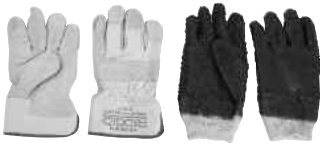
Рис. 4 – Рукавицы RIDGID для чистки канализации – кожаные и из ПВХ