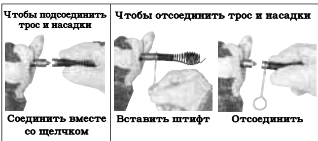
Рис. 7 – Подсоединение и отсоединение насадок

При использовании удлинительного шнура питания следует учитывать, что УЗО в инструменте для чистки канализации не обеспечивает защиту для удлинительного шнура. Если электрическая розетка не оборудована УЗО, рекомендуется использовать вилку с защитой УЗО между розеткой и удлинительным шнуром питания, чтобы снизить опасность поражения электрическим током в случае неисправности удлинительного шнура.