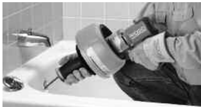
Рис. 9 – Протолкните трос дальше в канализационную трубу